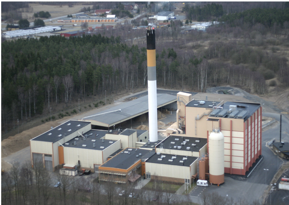
Beleverket, Hässleholm Miljö AB